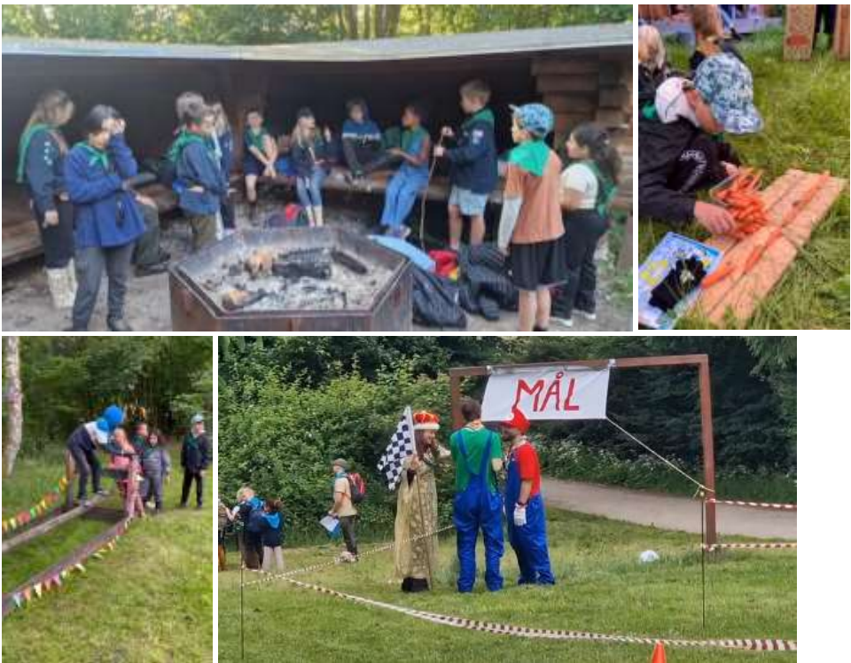
Første halvår blev traditionen tro afsluttet på Mikkelpborg Strand med is og badning.