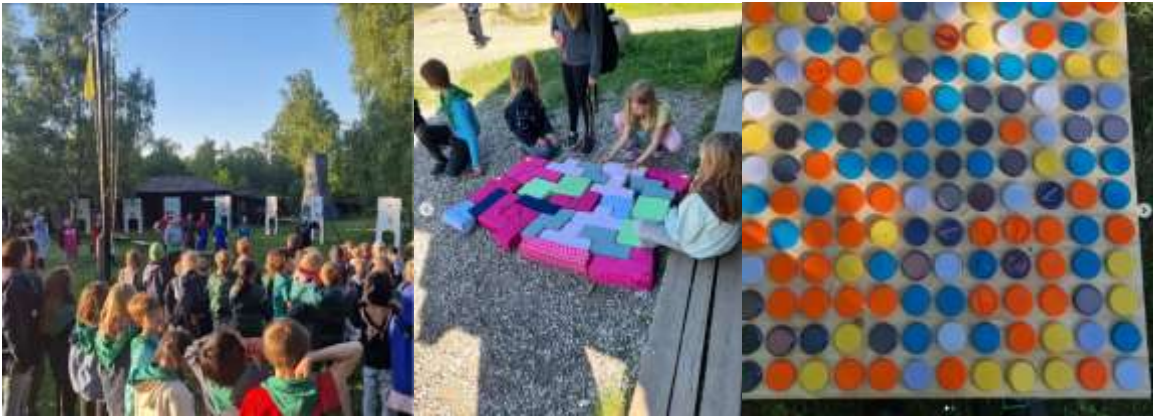
Senere på foråret tog vi igen til Gurredam, hvor vi deltog i MiniDivi - igen med spil som tema.