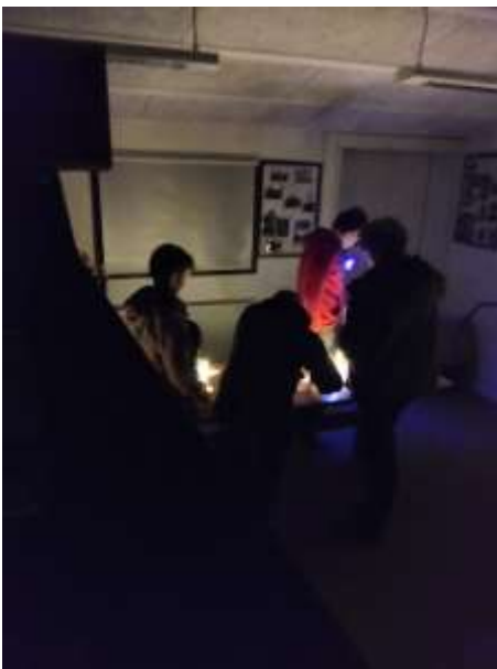
Raketter og Isdessert-bod: